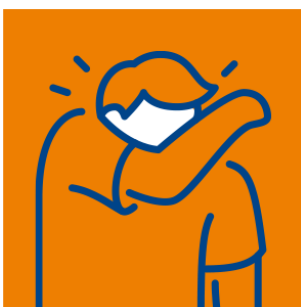
Husten- und Niesetikette beachten